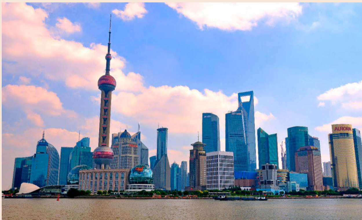
Distrito financiero de Pudong, en Shanghái.

"El hecho de que haya mucha gente que quiere conseguir contratos con un número relativamente pequeño de clientes ha dado lugar a una competencia feroz, lo que ha reducido los precios. Además, la idea de necesitar un abogado para las operaciones es nueva en China. Como consecuencia, las tarifas están en el