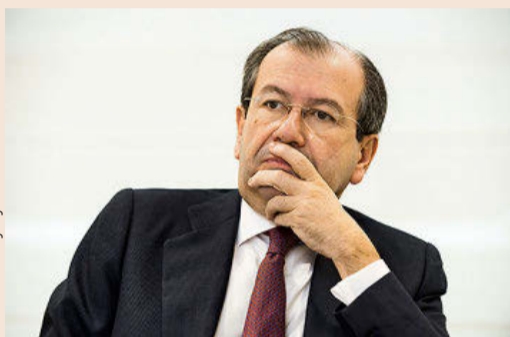
FERNANDO VIVES Presidente ejecutivo de Garrigues

En el primer semestre, se han contabilizado 1.054 operaciones en España, que suponen un importe de 45.284 millones de euros, según TTR. Inmobiliario lidera el ranking, seguido del sector tecnológico, que también figura en las apuestas de los bufetes.